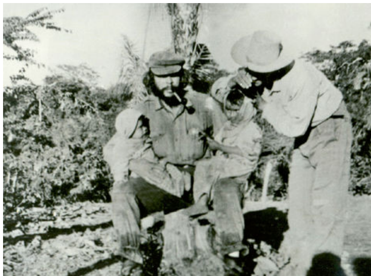
Ernesto Guevara.

Colección. El tomo VI de 'Bolivia, su historia' revisa y analiza los anales más recientes